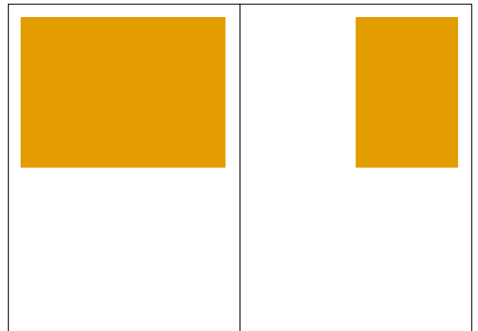
1/2 Seite quer